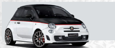
Scorpione Schwarz/Gara Weiß