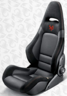
Stoff, Schwarz Aufgesticktes Logo "595", rot (Serienausstattung)