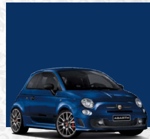
Podio Blau (voraussichtlich verfügbar ab Q4/2015)