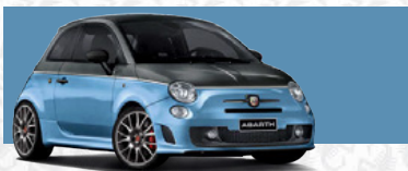
Pista Grau/Leggenda Hellblau