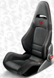
Leder*/Alcantara®, Schwarz Aufgesticktes Logo "595", rot (Sonderausstattung)