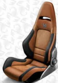
Leder*/Alcantara®, Braun Aufgesticktes Logo "595", grau (Sonderausstattung)