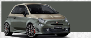
Rally Beige/Trofeo Grau