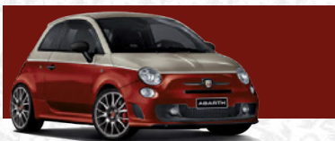
Rally Beige/Officina Rot