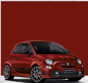
Officina Rot (Serienausstattung)