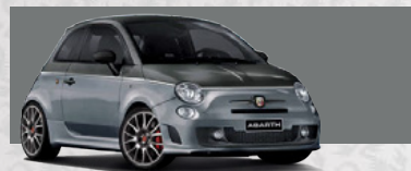
Pista Grau/Campovolo Grau