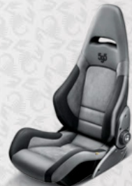
Leder*/Alcantara®, Grau Aufgesticktes Logo "595", schwarz (Sonderausstattung)