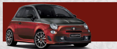
Pista Grau/Officina Rot