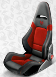
Leder*/Alcantara®, Rot Aufgesticktes Logo "595", rot (Sonderausstattung)